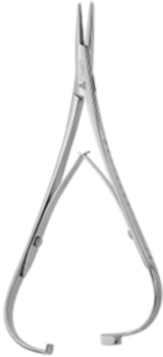
Porta agujas Mathieu