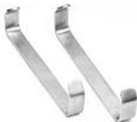
SEPARADORES DE FARAEOF